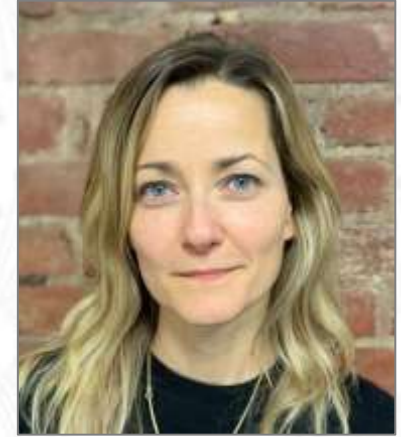
Clara Alemann Equimundo: Center for Masculinities and Social Justice