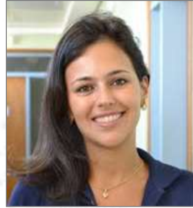
Carolina Coll International Center for Equity in Health, Universidade Federal de Pelotas